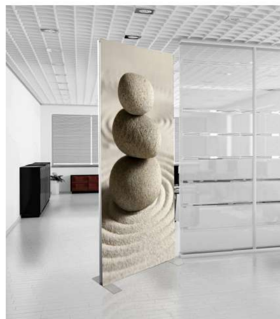
Base d'appoggio in metallo verniciato color argento.